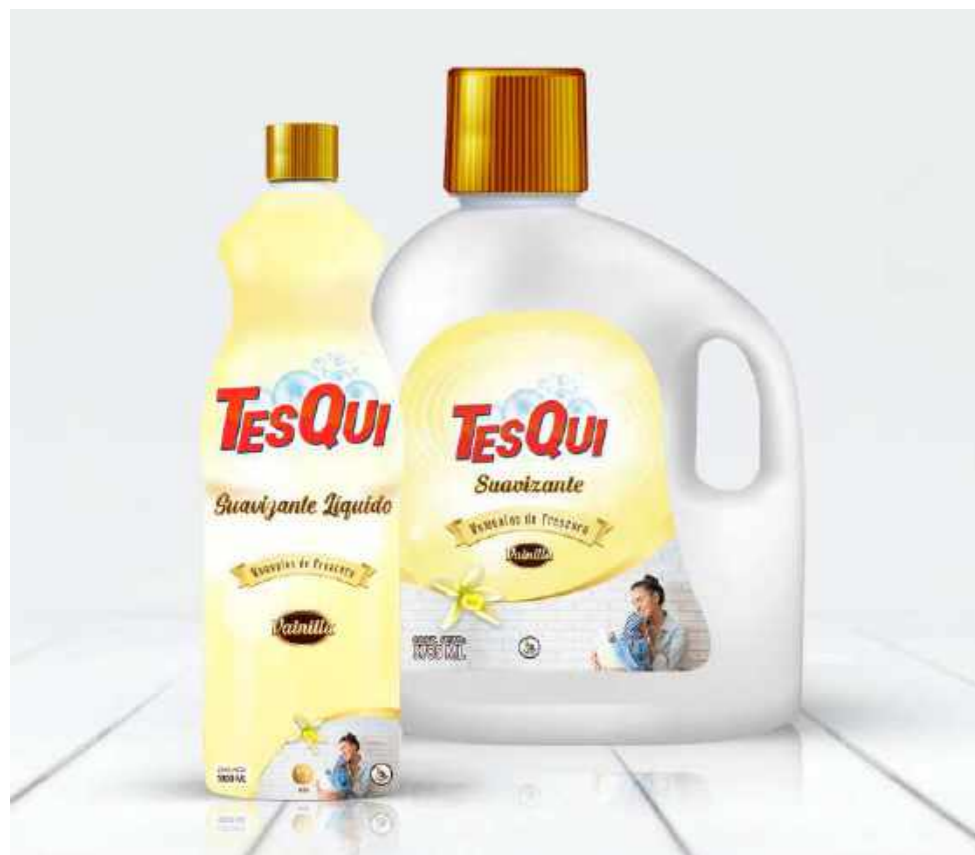
1 Lt. Vainilla Cód: 02050602

Suavizante TESQUI viene en presentaciones de litro y galón.