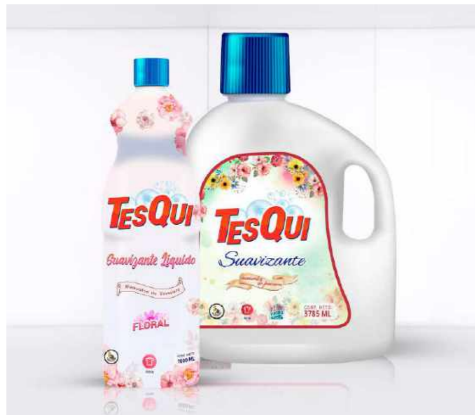
1 Lt. Floral Cód: 02050302