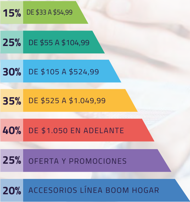
TABLA DE DESCUENTOS Y COMISIONES POR LÍNEAS Y PRODUCTOS